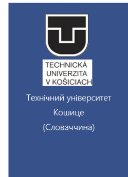
Технічний університет Кошице (Словаччина)