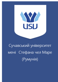
Сучавський університет мені Стефана чел Маре (Румунія)