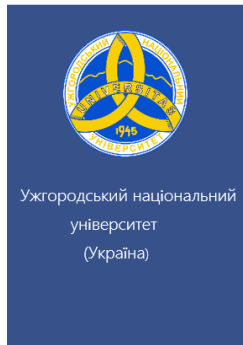
Ужгородський національний університет (Україна)